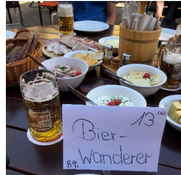
Brotzeit für Bierwanderer.

Der Treffpunkt in Memmelsdorf wird bei Anmeldung mitgeteilt.