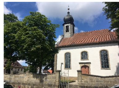
Foto: Kirche St. Laurentius in Strullendorf.

Unkostenbeitrag 7,50 Euro p.P., max. 15 Teilnehmer, Länge ca. 2 km. Treffpunkt in Strullendorf, wird bei Anmeldung mitgeteilt.